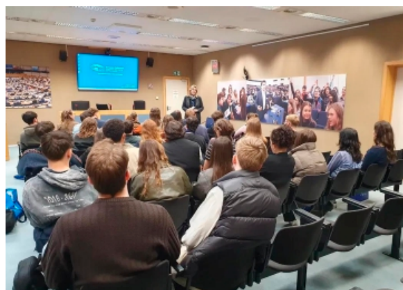
Besuchergruppe der „Europäischen Jugendbegegnungsstätte Magdeburg“ zu Besuch im Europäischen Parlament in Brüssel