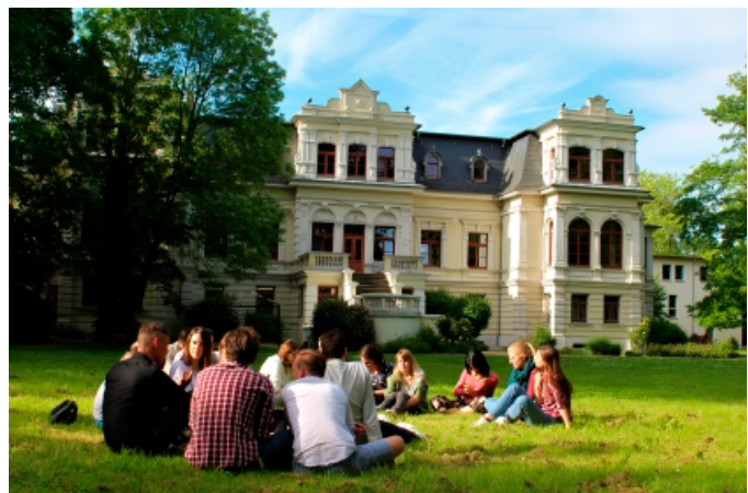
Jugendbegegnung in der EJBM

Ein besonderer Akzent liegt dabei auf der deutsch-französischen Jugendarbeit, die in Sachsen-Anhalt ausschließlich von der EJBM kontinuierlich getragen wird. Gerade vor dem Hintergrund der besonderen Bedeutung der deutsch-französischen Zusammenarbeit für Europa ist dies ein wichtiger Beitrag zur europäischen Verständigung aus Sachsen-Anhalt heraus.