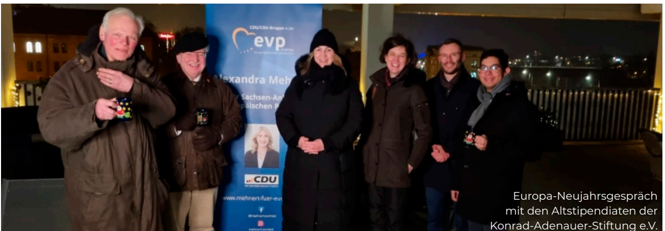
Europa-Neujahrsgespräch mit den Altstipendiaten der Konrad-Adenauer-Stiftung e.V.