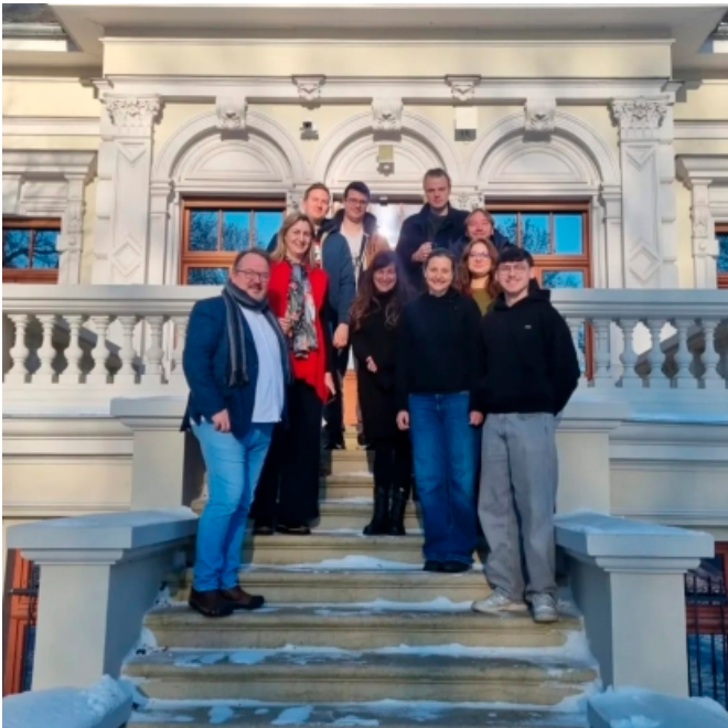
Europäische Begegnungsstätte Magdeburg

Europa zeigt seine Stärke dort, wo politische Entscheidungen in konkrete Chancen für Menschen übersetzt werden. In Sachsen-Anhalt geschieht das besonders sichtbar im Bereich der europäischen Jugend- und Bildungsarbeit. Einen maßgeblichen Beitrag dazu leisten die Europäische Jugendbildungsstätte Magdeburg (EJBM) mit ihren angeschlossenen Einrichtungen GOEUROPE! und EUROPE DIRECT Halle.