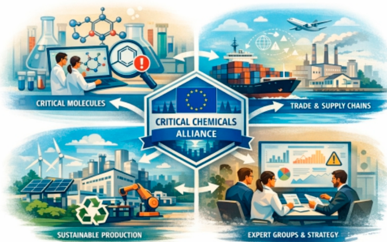
Illustration generiert mit KI

Da die Energie- und Industriepolitik für meinen Wahlkreis von zentraler Bedeutung ist, liegt hier ein Schwerpunkt meiner Arbeit. In einem fachlichen Austausch mit Vertreterinnen und Vertretern von Statkraft standen insbesondere der Abbau bürokratischer Hürden, wettbewerbsfähige Energiepreise sowie die langfristige Sicherung der Wettbewerbsfähigkeit des Standorts Sachsen-Anhalt im Mittelpunkt. Gerade die chemische Industrie steht derzeit unter erheblichem Druck und benötigt verlässliche sowie wirtschaftlich tragfähige Rahmenbedingungen.