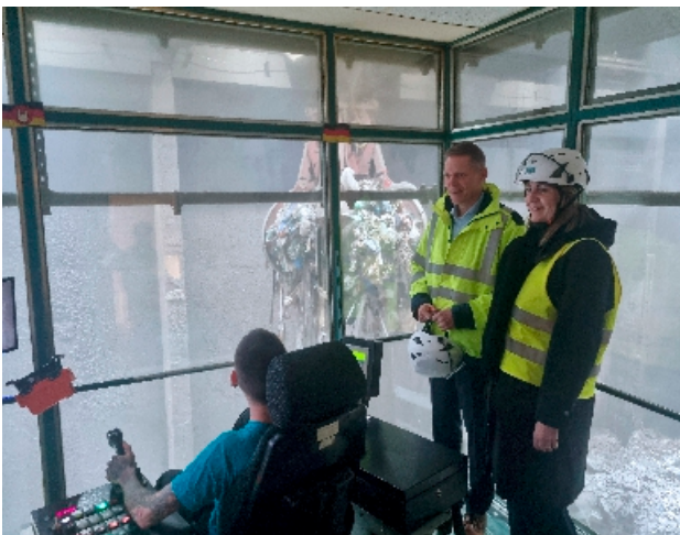
Besuch bei der Müllheizkraftwerk Rothensee GmbH

Unter dem Motto „Des einen Müll ist des anderen Schatz“ informierte ich mich Ende Januar bei der Müllheizkraftwerk Rothensee GmbH über aktuelle Herausforderungen der Abfallverwertung.