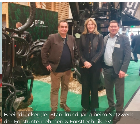
Beeindruckender Standrundgang beim Netzwerk der Forstunternehmen & Forsttechnik e.V.