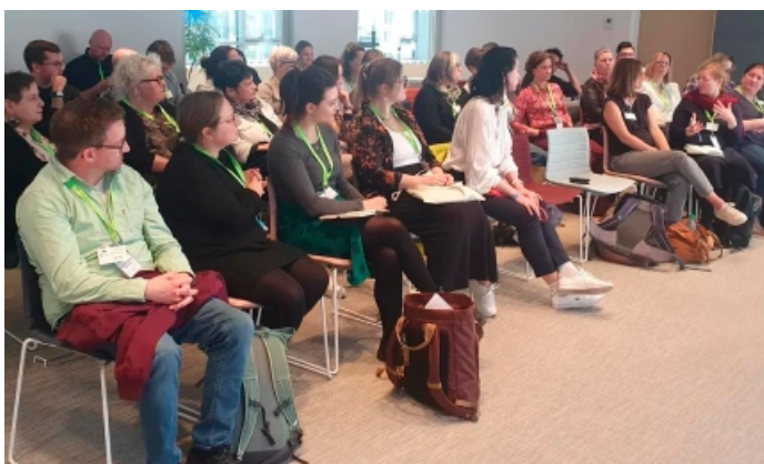
Europaschullehrerinnen und Europaschullehrer zu Besuch im Europäischen Parlament in Brüssel

Die Budgetierung der Gemeinsamen Agrarpolitik im neuen Mehrjährigen Finanzrahmen ist Gegenstand intensiver Diskussionen. Im Vorschlag der Europäischen Kommission ist vorgesehen, dass ein neuer Partnerschaftsfonds insgesamt rund 865 Milliarden Euro umfasst, in dem auch Mittel für Einkommensstützung und ländliche Entwicklung gebündelt werden sollen. Die EU-Mitgliedstaaten sollen laut Europäischer Kommission, dabei mehr Spielraum bei der konkreten Ausgestaltung der Programme erhalten, was politische Debatten über Wirksamkeit, Transparenz und faire Wettbewerbsbedingungen ausgelöst hat. Gleichzeitig spielen in den MFR-Verhandlungen grundlegende Finanzierungsfragen eine zentrale Rolle, insbesondere wie der EU-Haushalt langfristig stabil ausgestaltet werden kann, ohne zusätzlichen Druck auf zentrale Politikbereiche wie die Landwirtschaft auszuüben. Diskutiert werden daher auch neue Eigenmittel der Europäischen Union, um die Belastung der Mitgliedstaaten zu begrenzen und Investitionen in Zukunftsbereiche abzusichern.