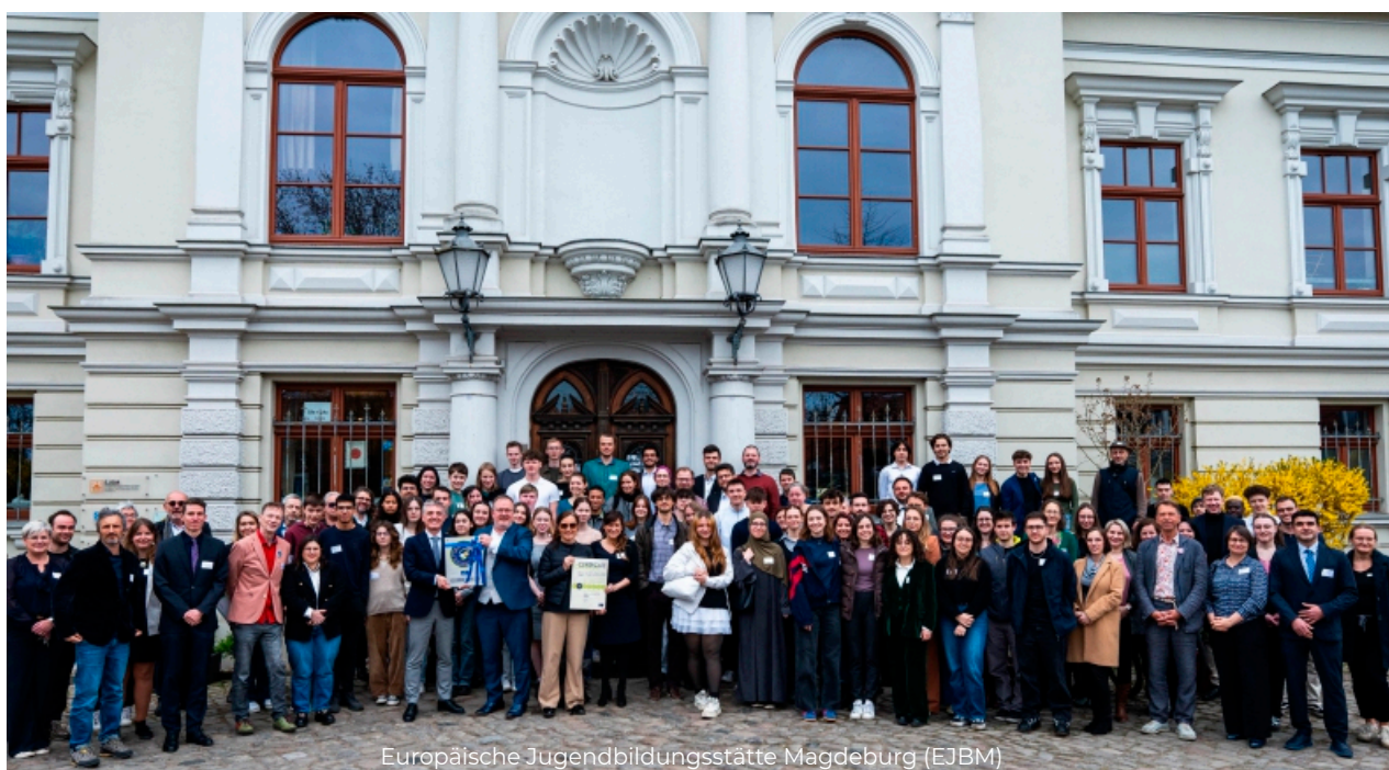
Europäische Jugendbildungsstätte Magdeburg (EJBM)