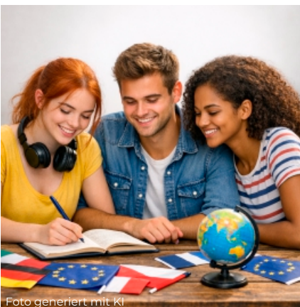
Foto generiert mit KI

Die Arbeit der EJBM mit GOEUROPE! und EUROPE DIRECT Halle zeigt eindrucksvoll, wie europäische Förderprogramme verantwortungsvoll und wirkungsorientiert für Sachsen-Anhalt eingesetzt werden können. Junge Menschen im Land profitieren davon ganz konkret: Sie erwerben internationale und soziale Kompetenzen, stärken ihre Sprachkenntnisse, entwickeln Selbstständigkeit und interkulturelles Verständnis.