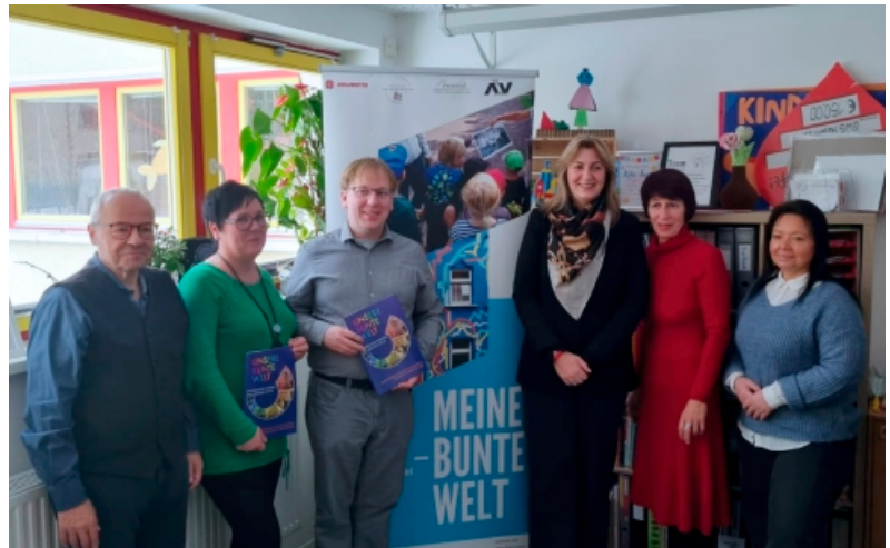
Besuch in der Kita „Beimskinder“

Aus gutem Grund hat sich die Einrichtung mit Unterstützung der Architektenkammer Sachsen-Anhalt für den internationalen „Golden Cube Award“ beworben. Diese Auszeichnung wird von der Weltorganisation der Architekten (UIA) alle drei Jahre an herausragende Bildungsprojekte verliehen. Geehrt werden Projekte, Personen, Institutionen oder Medien, die Kindern und Jugendlichen helfen, Architektur und die gebaute Umwelt besser zu verstehen.