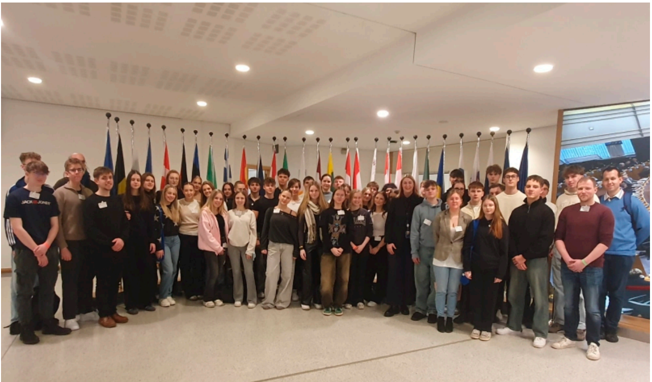
Besucherguppe im Europäischen Parlament in Brüssel