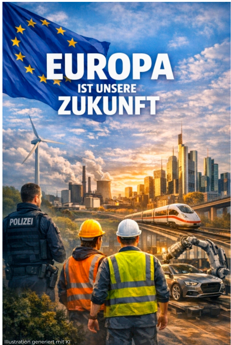
Illustration generiert mit KI

Dafür setze ich mich im Europäischen Parlament in Brüssel und Straßburg mit Nachdruck ein.