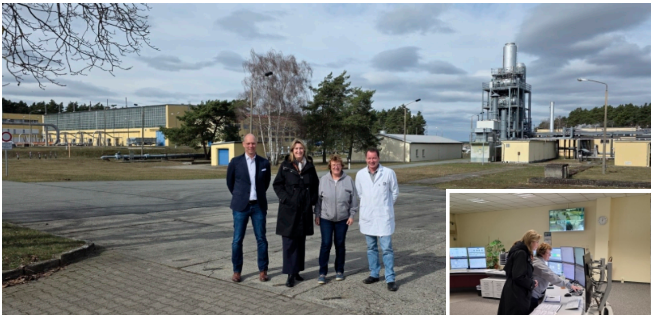
Besuch bei Neptune Energy

Die Chemieparks zeigen eindrucksvoll, wie industrielle Tradition und Innovation zusammenwirken und damit einen wichtigen Beitrag zur wirtschaftlichen Entwicklung der gesamten Region leisten.