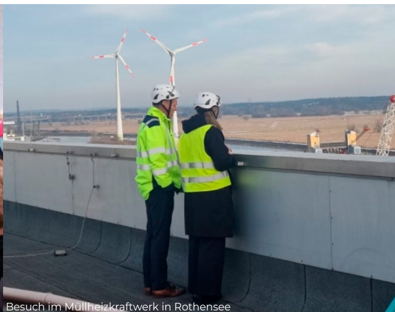
Besuch im Müllheizkraftwerk in Rothensee

Neben den Themen Agrarpolitik und Kultur ist auch die europäische Bildung ein entscheidender Aspekt für die Zukunft Sachsen-Anhalts. Wie die europäische Bildungsarbeit in unserem Bundesland aussieht und welche Vorteile besonders junge Menschen daraus ziehen können, erfahren Sie im Gastbeitrag der Europäischen Jugendbildungsstätte Magdeburg (EJBM). Die Förderung von Bildung und interkulturellem Austausch ist ein zentrales Anliegen der EU und bietet jungen Menschen in Sachsen-Anhalt wertvolle Chancen, sich europaweit zu vernetzen und weiterzuentwickeln. Ich empfehle diesen Gastbeitrag besonders allen jungen Menschen aus unserem Land, da er wertvolle Einblicke in die europäischen Bildungsangebote und -möglichkeiten gibt.