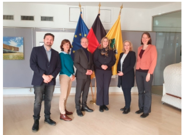
Zu Besuch bei der Vertretung des Landes Sachsen-Anhalt bei der Europäischen Union

Auch internationale Partnerschaften standen auf meiner Agenda. Als Mitglied der interparlamentarischen Delegation zu Mexiko habe ich mit dem designierten Leiter der Konrad-Adenauer-Stiftung in Mexiko über die europäisch-mexikanischen Beziehungen und aktuelle geopolitische Entwicklungen gesprochen.