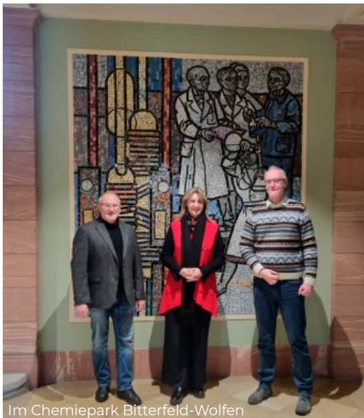
Im Chemiepark Bitterfeld-Wolfen