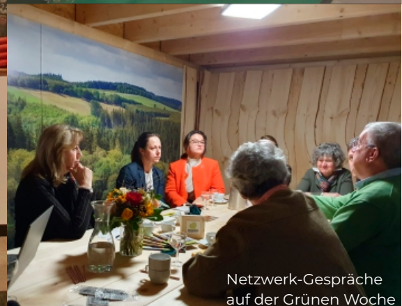
Netzwerk-Gespräche auf der Grünen Woche