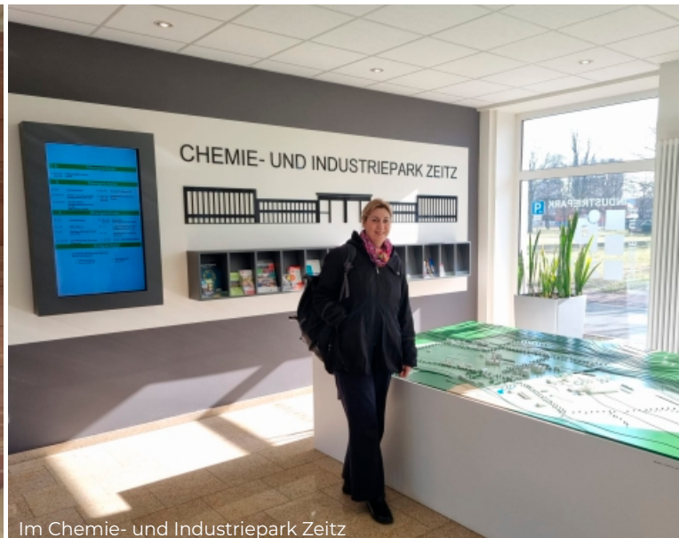
Im Chemie- und Industriepark Zeitz

Einen weiteren Einblick in die wirtschaftliche Stärke der Region boten mir die Chemieparks Bitterfeld-Wolfen und Zeitz , zwei der bedeutendsten Industriestandorte Sachsen-Anhalts.