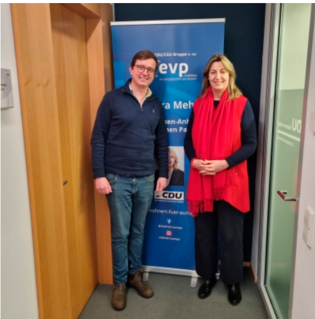
Im Austausch mit der Agrardienst Moshake GmbH