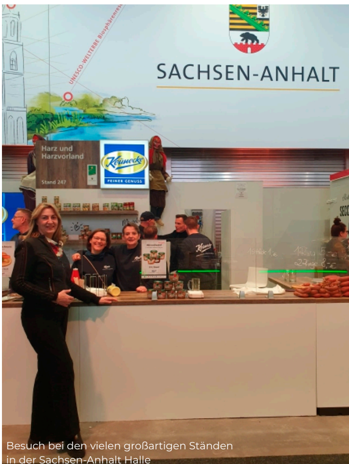
Besuch bei den vielen großartigen Ständen in der Sachsen-Anhalt Halle