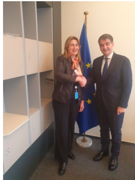
EU-Kommissar für Kohäsion, Reformen, Regionalpolitik und Städte Raffaele Fitto

Die Budgetierung der Gemeinsamen Agrarpolitik im neuen Mehrjährigen Finanzrahmen ist Gegenstand intensiver Diskussionen. Im Vorschlag der Europäischen Kommission ist vorgesehen, dass ein neuer Partnerschaftsfonds insgesamt rund 865 Milliarden Euro umfasst, in dem auch Mittel für Einkommensstützung und ländliche Entwicklung gebündelt werden sollen. Die EU-Mitgliedstaaten sollen laut Europäischer Kommission, dabei mehr Spielraum bei der konkreten Ausgestaltung der Programme erhalten, was politische Debatten über Wirksamkeit, Transparenz und faire Wettbewerbsbedingungen ausgelöst hat. Gleichzeitig spielen in den MFR-Verhandlungen grundlegende Finanzierungsfragen eine zentrale Rolle, insbesondere wie der EU-Haushalt langfristig stabil ausgestaltet werden kann, ohne zusätzlichen Druck auf zentrale Politikbereiche wie die Landwirtschaft auszuüben. Diskutiert werden daher auch neue Eigenmittel der Europäischen Union, um die Belastung der Mitgliedstaaten zu begrenzen und Investitionen in Zukunftsbereiche abzusichern.